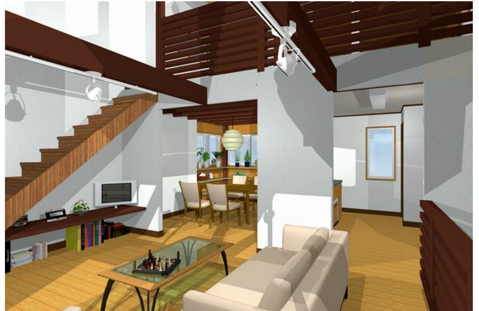
2階リビング～ダイニング・キッチン