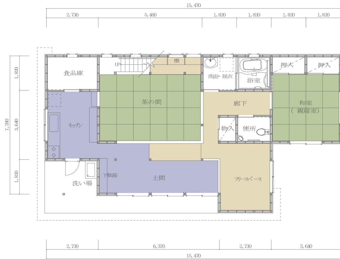
1階平面図 S: 1/100