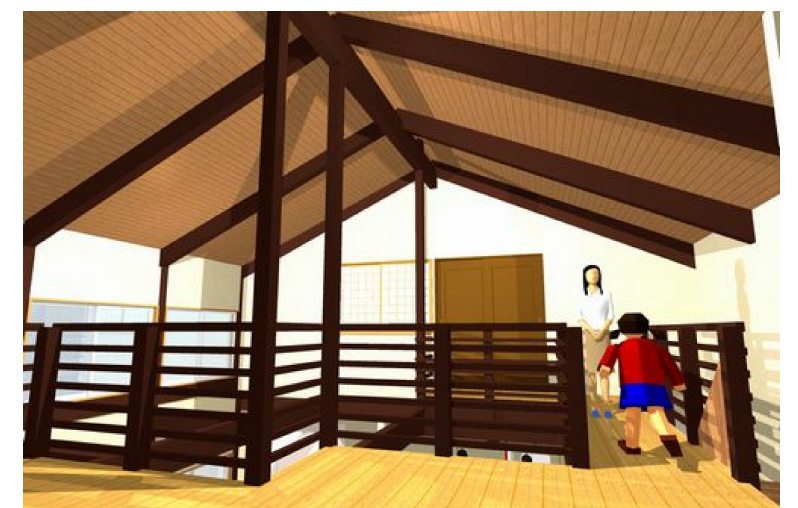
2階フリースペース～吹き抜け